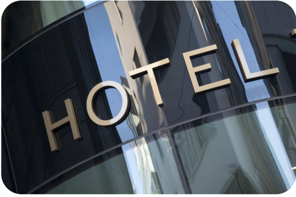
DANUBIUS HUNGARIA BUDAPEST