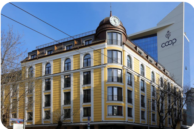
HOTEL COOP SOFIA 4* SOFÍA