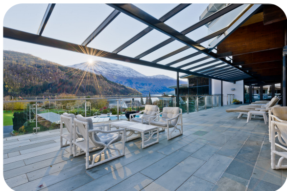
HOTEL LOENFJORD SOGNEFJORD