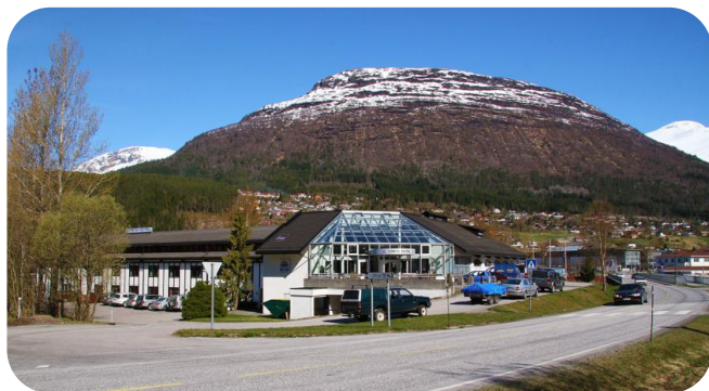
STRYN HOTEL NORDFJORDEID

Todas las habitaciones del Stryn Hotel disponen de TV vía satélite, escritorio y baño privado con ducha.