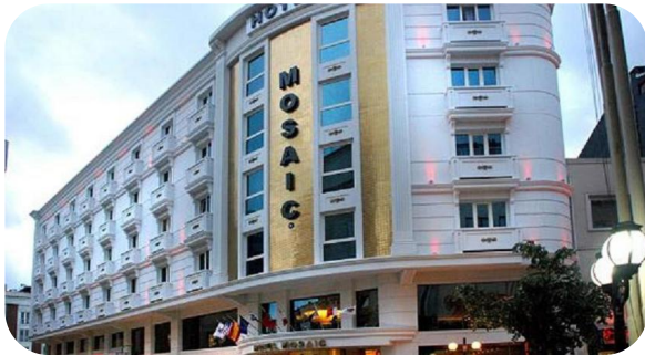
MOSAIC HOTEL ESTAMBUL