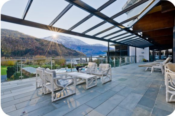
HOTEL LOENFJORD LOEN