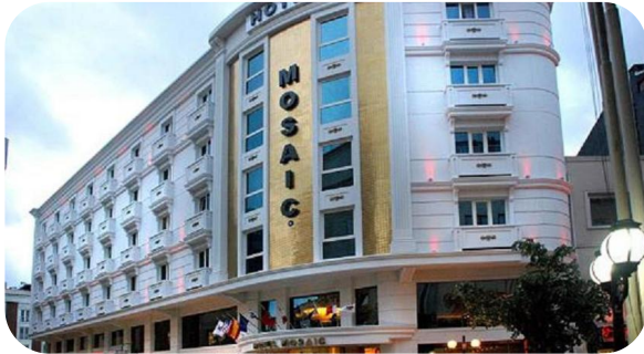
MOSAIC HOTEL ESTAMBUL